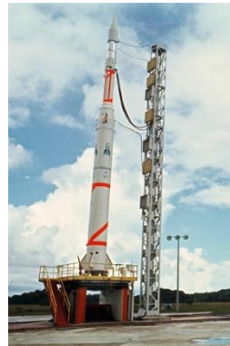
Diamant, 1 er lanceur spatial léger français.

1970 , des hommes et des femmes décident de changer profondément le modèle social du groupe Aerospatiale.